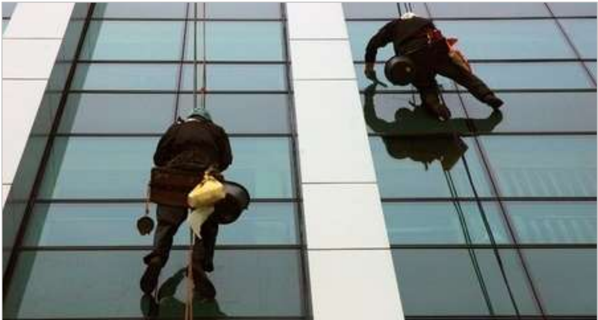
Poetsen aan de buitenkant