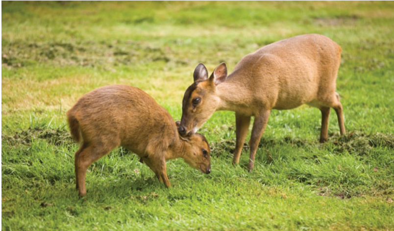
De Chinese muntjak leeft solitair of in paartjes. Door hun karakteristieke waarschuwingsgeluid worden ze ook wel blaffherten genoemd.

Naast beoogde doelen kan communicatie ook onbedoelde effecten hebben. Wie niet goed communiceert, kan grote schade toebrengen aan de belangen van de zorgvrager en de organisatie waarvoor hij werkt.